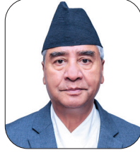
सम्माननीय प्रधानमन्त्री शेरबहादुर देउवा सम्माननीय प्रधानमन्त्री एवं अध्यक्ष