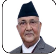
सम्माननीय प्रधानमन्त्री केपी शर्मा ओली सम्माननीय प्रधानमन्त्री एवं अध्यक्ष